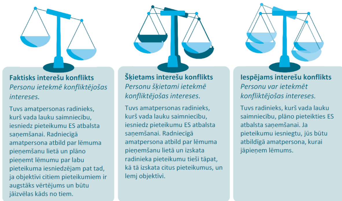
2.attēls. Faktiska, šķietama un iespējama interešu konflikta piemēri 36